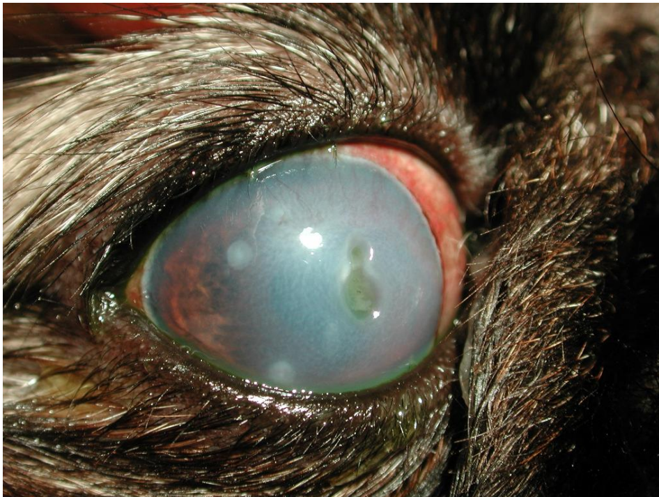
Die Distichien am Oberlid haben einen tiefen Hornhautdefekt verursacht. Es sind mehrere verheilte Defekte zu sehen.