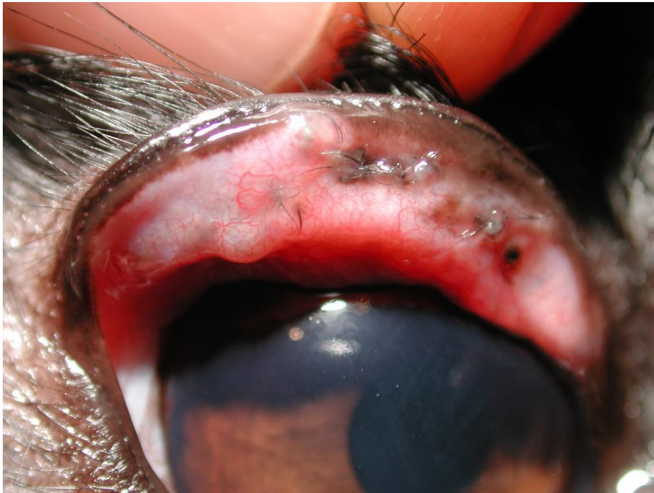
Massenhaft ektope Zilien(büschel) am Oberlid.