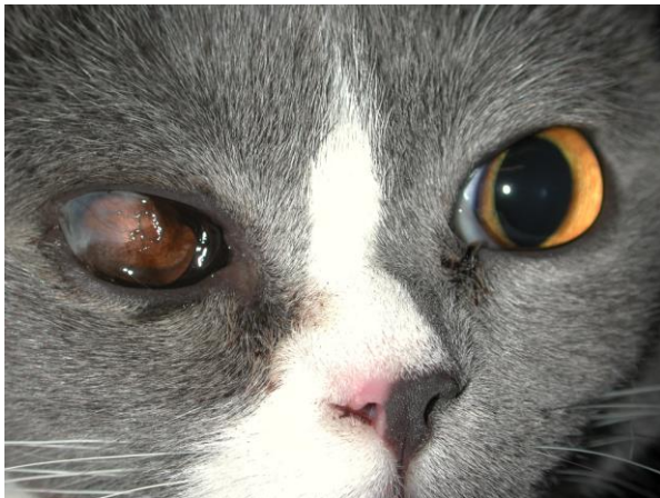
Ausgedehnte Verwachsungen und Pigmentierungen der Bindehaut auf dem rechten Auge infolge FHV.