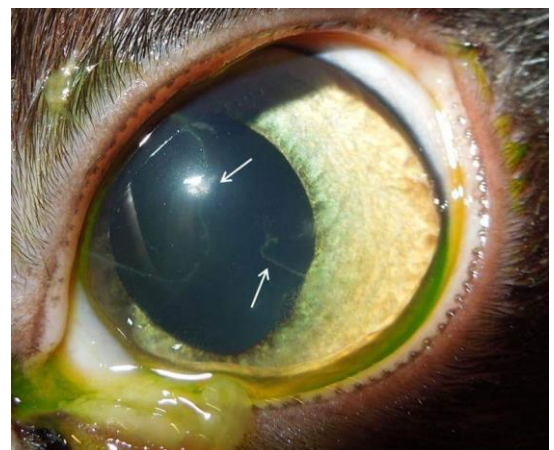
Ähnlicher Defekt auf der anderen Seite.