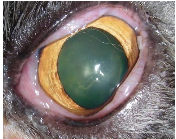
Gerötete, geschwollene Bindehäute.