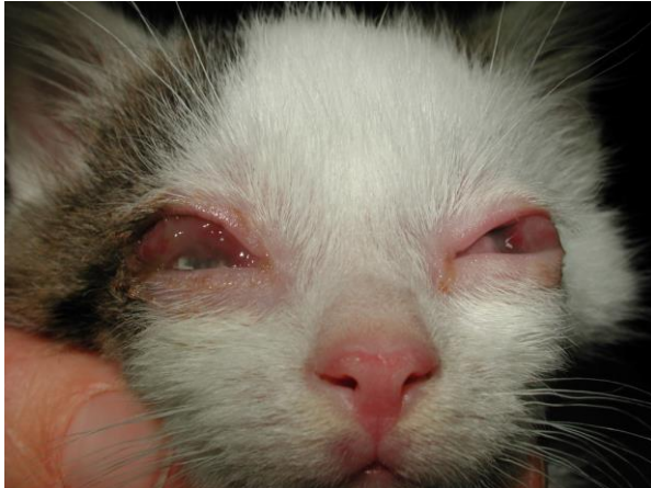
Junge Katze mit geschwollenen Bindehäuten und Nase durch FHV.