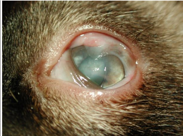
Verwachsungen zwischen Bindehaut und Hornhaut infolge einer FHV-Infektion.